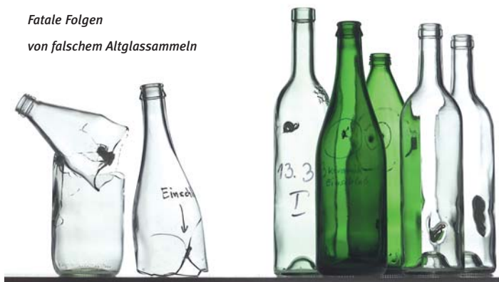
Fatale Folgen von falschem Altglassammeln

Die Recyclingquote beträgt rund 85 Prozent, das heißt sechs von sieben produzierten Glasverpackungen ist ein neues Leben garantiert. Jährlich sammeln die Österreicherinnen und Österreicher rund 200.000 Tonnen Altglas, das entspricht rund 680 Millionen Glasverpackungen. Diese aneinander gereiht ergäben eine Strecke von zirka 170.000 km. Das ist mehr als vier Mal um den Äquator. Aufgeschüttet auf einem Fußballfeld wäre der Berg an Glasverpackungen rund 100 Meter hoch.